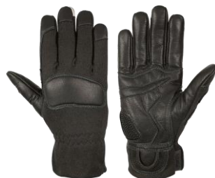
Anika Quick Black