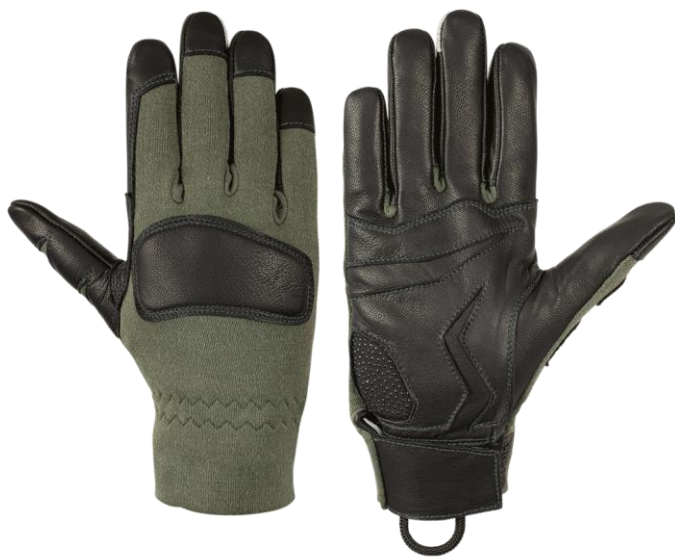
Anika Short Green